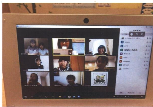
みんなしっかり発話できていました